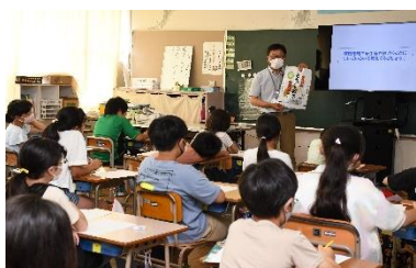
『棚田米SDGsプロジェクト』

広報誌を毎月発行し、安全・安心な食に関する情報提供や地域の話題、農業の担い手紹介、青年部・女性部の活動内容などを掲載しています。また、ディスクロージャー、ホームページ・SNSによる情報提供、地域のコミュニティFM局のラジオ番組に出演、マスコミとの記者懇談会の開催などJAの取り組みについて積極的に情報を発信しています。