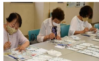
『助けあい組織 暑中見舞いの作成』

健康づくり活動の一環として、人間ドック受診者への助成を行いました。また、「JAえちご上越杯マさんバレーボール選手権大会」「JAえちご上越旗争奪幼年野球大会」等も開催し、地域全体の健康な生活支援を行っています。