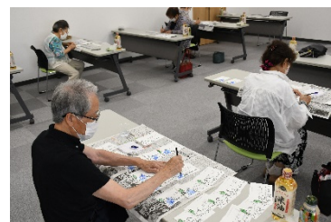
『助けあい組織 - 暑中見舞いVカキ作成 - 』

組合員とその家族や地域の方々がお互いに力を合わせ、助け合いを通して安心して暮らせる心豊かな地域づくりを目指して、各地域の「助けあい組織」活動において激励絵手紙・声掛け安否確認・施設ボランティア等の活動を行っています。