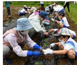
『支店協同活動 - えこもりん'Sクラブ - 』

各地域の特性を活かし「文化活動」「環境美化活動」等それぞれの支店が独自の企画に取り組み、地域に根差した活動を展開しています。また、次世代を担う小学生親子を対象に、楽しみながら食と農の魅力を学び、農業・JAへの関心を高め、理解を深めることを目的にJAキッズスクール「えこもりん'Sクラブ」の活動を展開しています。