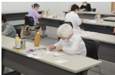
『助けあい組織 暑中見舞いの作成』