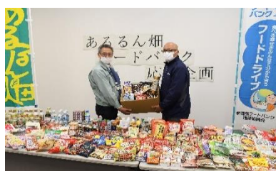
『フードバンクへの食品寄付』

広報誌を毎月発行し、安全・安心な食に関する情報提供や地域の話題、農業の担い手紹介、青年部・女性部の活動内容などを掲載しています。また、ディスクロージャー誌、ホームページ・SNSによる情報提供、地域のコミュニティFM局のラジオ番組に出演、マスコミとの記者懇談会の開催などJAの取り組みについて積極的に情報を発信しています。