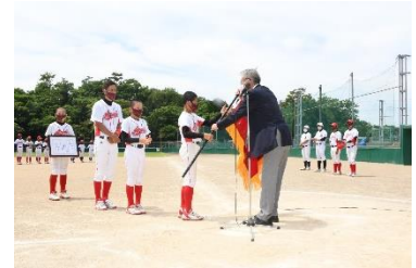
『JAえちご上越旗争奪幼年野球大会』

健康づくり活動の一環として、人間ドック受診者への助成を行いました。また、「JAえちご上越旗争奪幼年野球大会」等も開催し、地域全体の健康な生活支援を行っています。